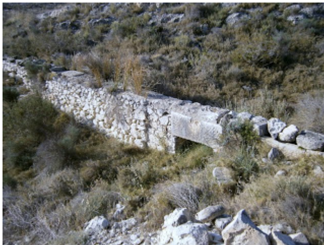
Acequia de la Font dels Escorfers