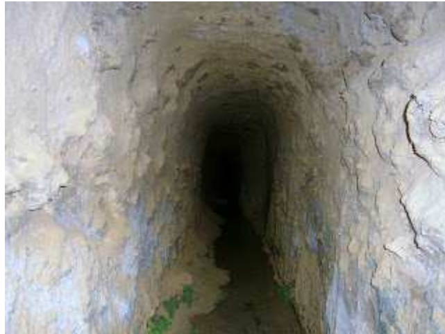
Mina de L'Animeta

La casa tiene dos fuentecillas; Una al lado de lo que fue la terraza, y otra frente a ella. Alguien le ha robado los grifos que hasta no hace mucho conservaban.