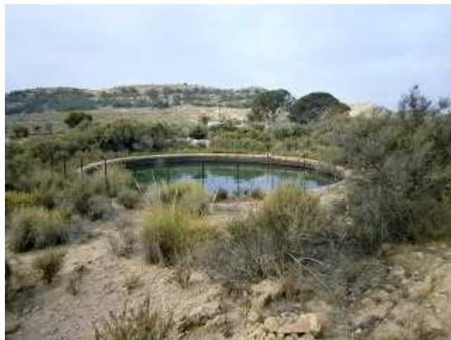
Balsa de L'Animeta

Estos manantiales, y otros repartidos por todo el término municipal de Elche, fueron analizados con la esperanza de obtener un caudal suficiente de agua para paliar las necesidades acuciantes de la ciudad. Fuentes como La Pinyolenca en la sierra del mismo nombre cerca del pantano, la mina de agua de Galán , o la Font dels Escorfers , por citar algunos.