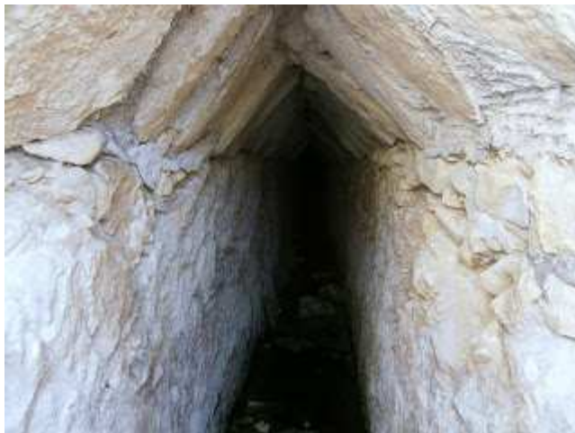
Font dels Escorfers