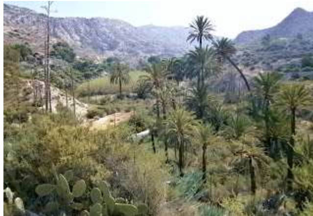
Racó de La Morera

Hacia el noroeste está la Font del Racó de la Morera o dels Olmets que en la actualidad es un pequeño toll y que en el pasado precipitaba sus aguas en una balsa situada al lado. Este manantial está en un pequeño bosquecillo de palmeras y olmos secos.