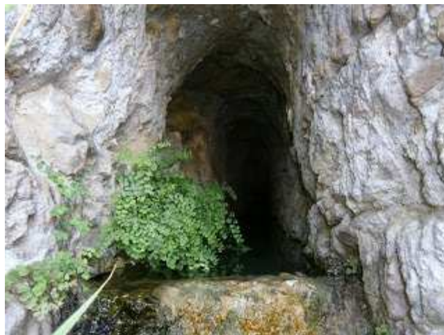
Font en el Racó de La Morera

Y hacia oriente hay un nacimiento de agua muy limpia que sale al exterior por un alcavón. (ignoro el nombre de esta fuente).