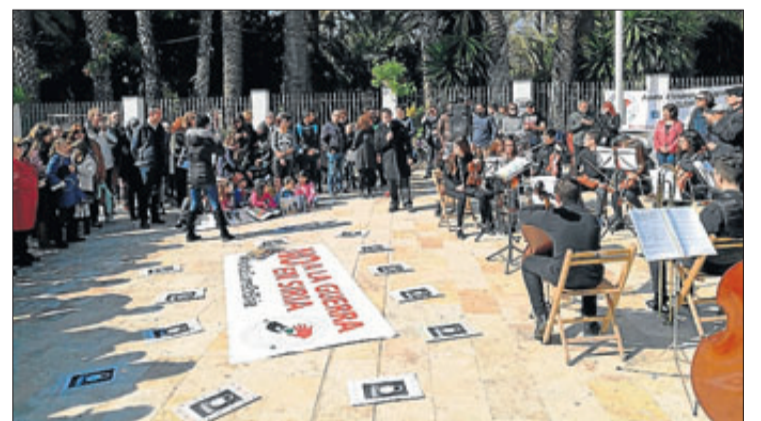
El acto reivindicativo, ayer, en el Paseo de la Estación.

El colectivo exigió al Gobierno medidas para garantizar la seguridad y la acogida de refugiados.