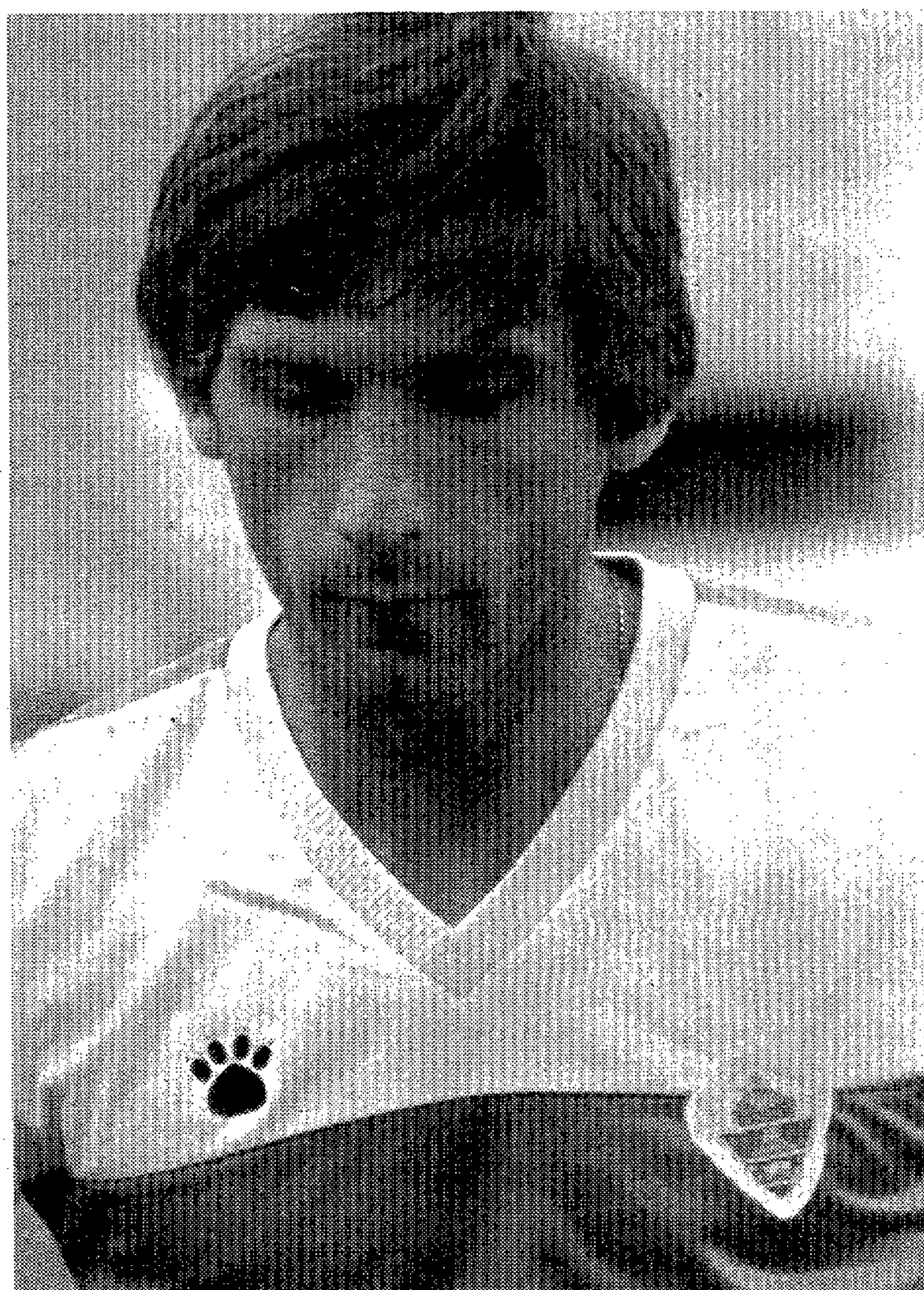
El yugoslavo, enfadado