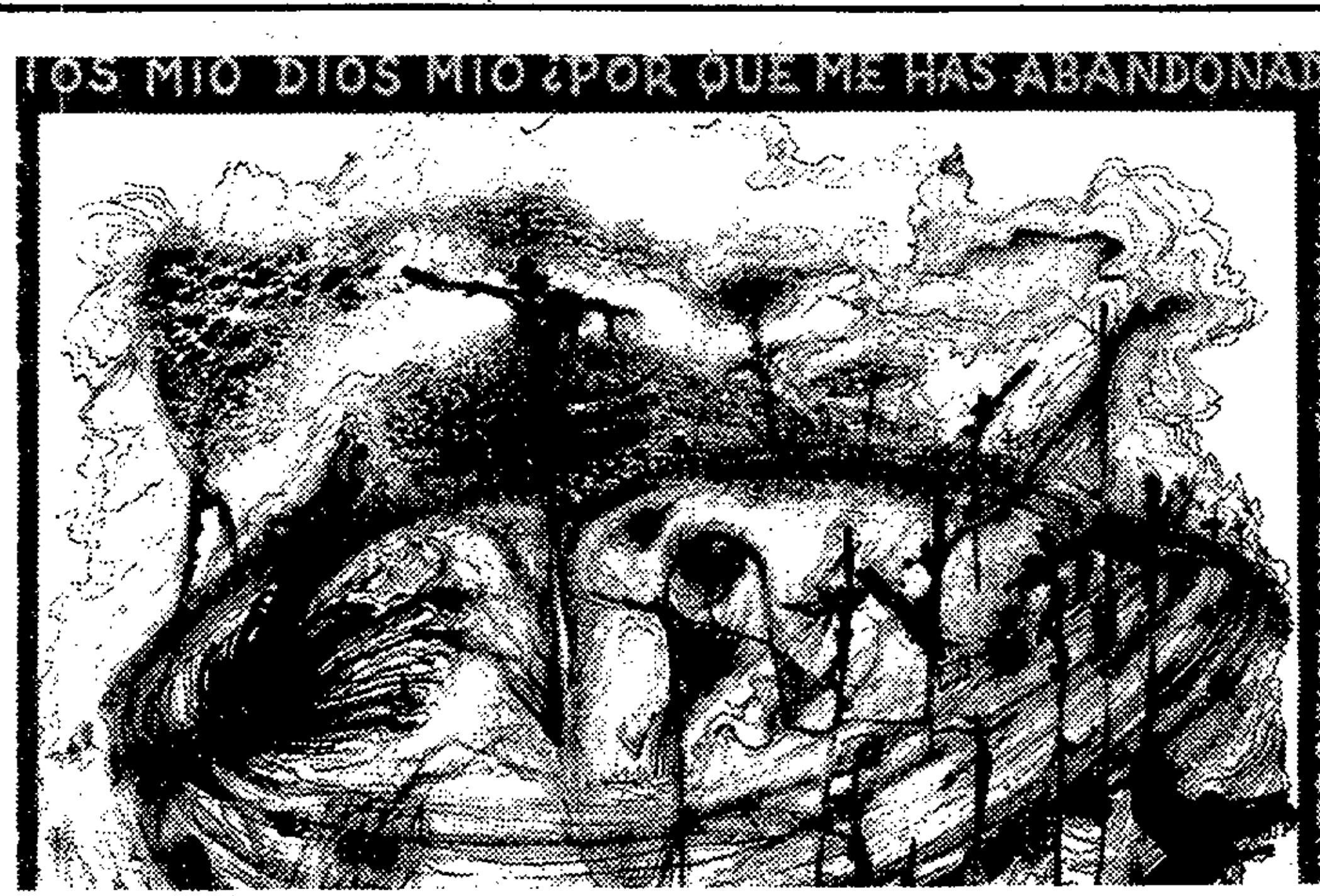
«33 subconsciencias» se inaugura el sábado

A las 8: Diario hablado de R.N.E.; 8,30: Primeras noticias; 9: Canciones a las nueve; 9,30: Radio-ciudad; 13,15: Noticias mediodía, incluyendo Kelme deporte; 14: Diario hablado de R.N.E.; 14,30: La Zarzuela: 1.ª parte de «La canción del olvido», de José Serrano; 15: Radio Elche-comarcas; 15,30: Canciones a las 15,30; 16: Cultura hoy; 16,30: Radiodeporte-opinión; 16,45: Especial Vega Baja; 17: Tarde para todos; 19: Reverberación 2.000; 20: Diario hablado de R.N.E.; 20,30: Informativo 3.ª edición; 21,15: Generación 2.000; 22: Mundiradio 82; 22,30: Boulevard R-2; 23: Informativo; 24: Cierre.