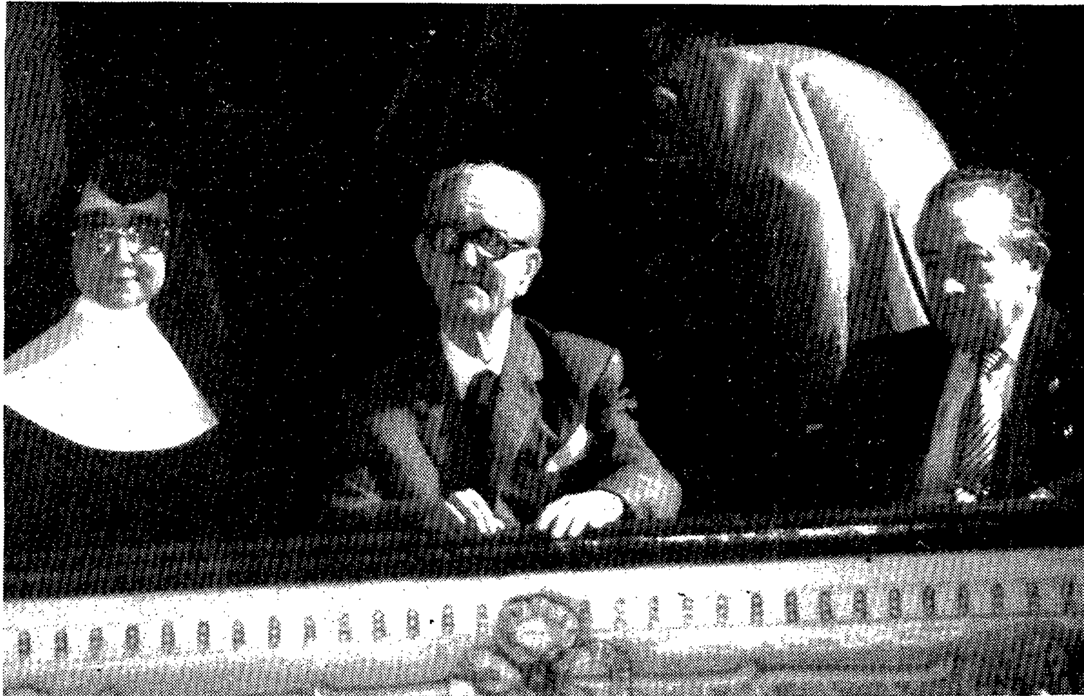
«Quitet», en el centro, junto al alcalde y la superiora del Asilo