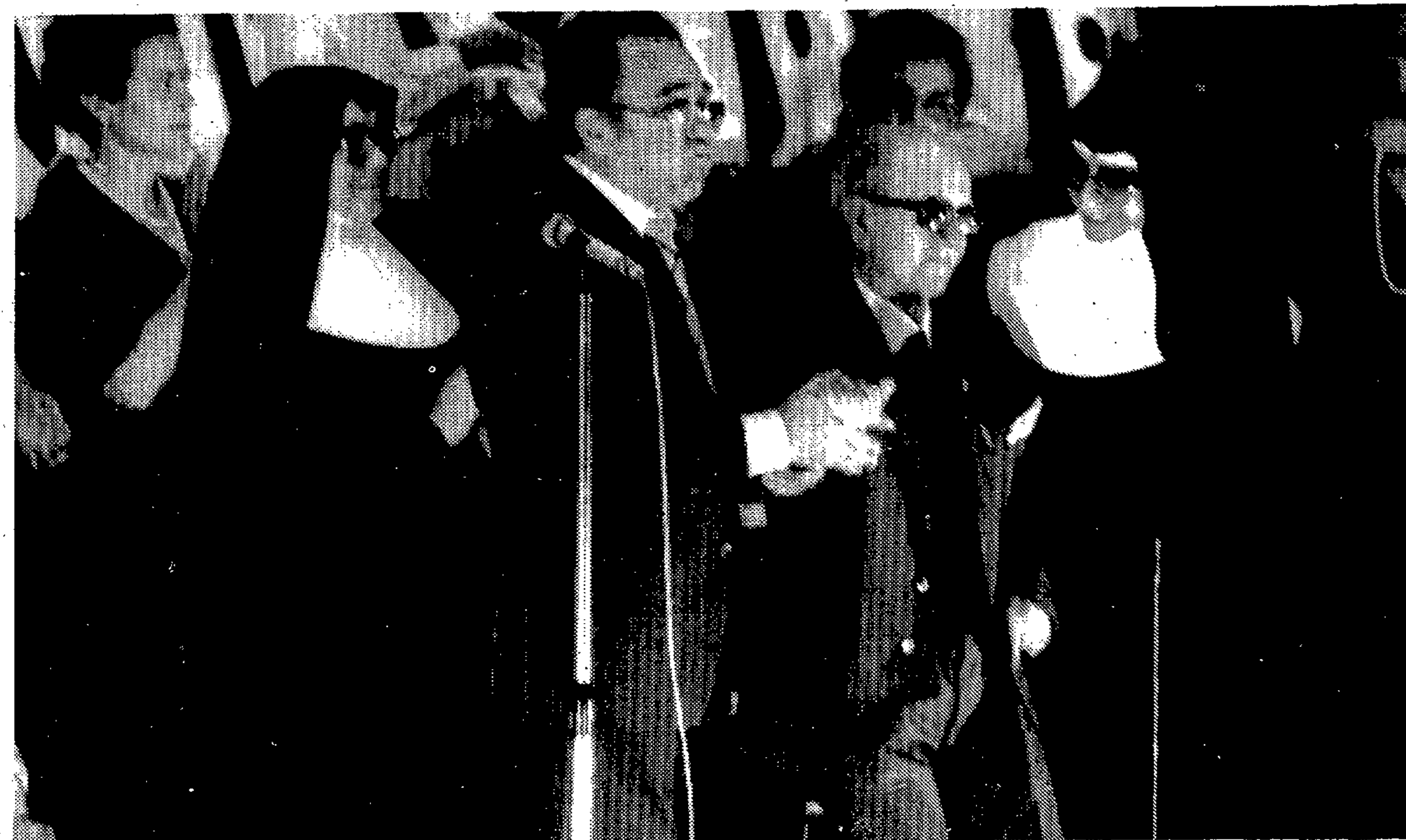
El homenaje le hizo saltar las lágrimas