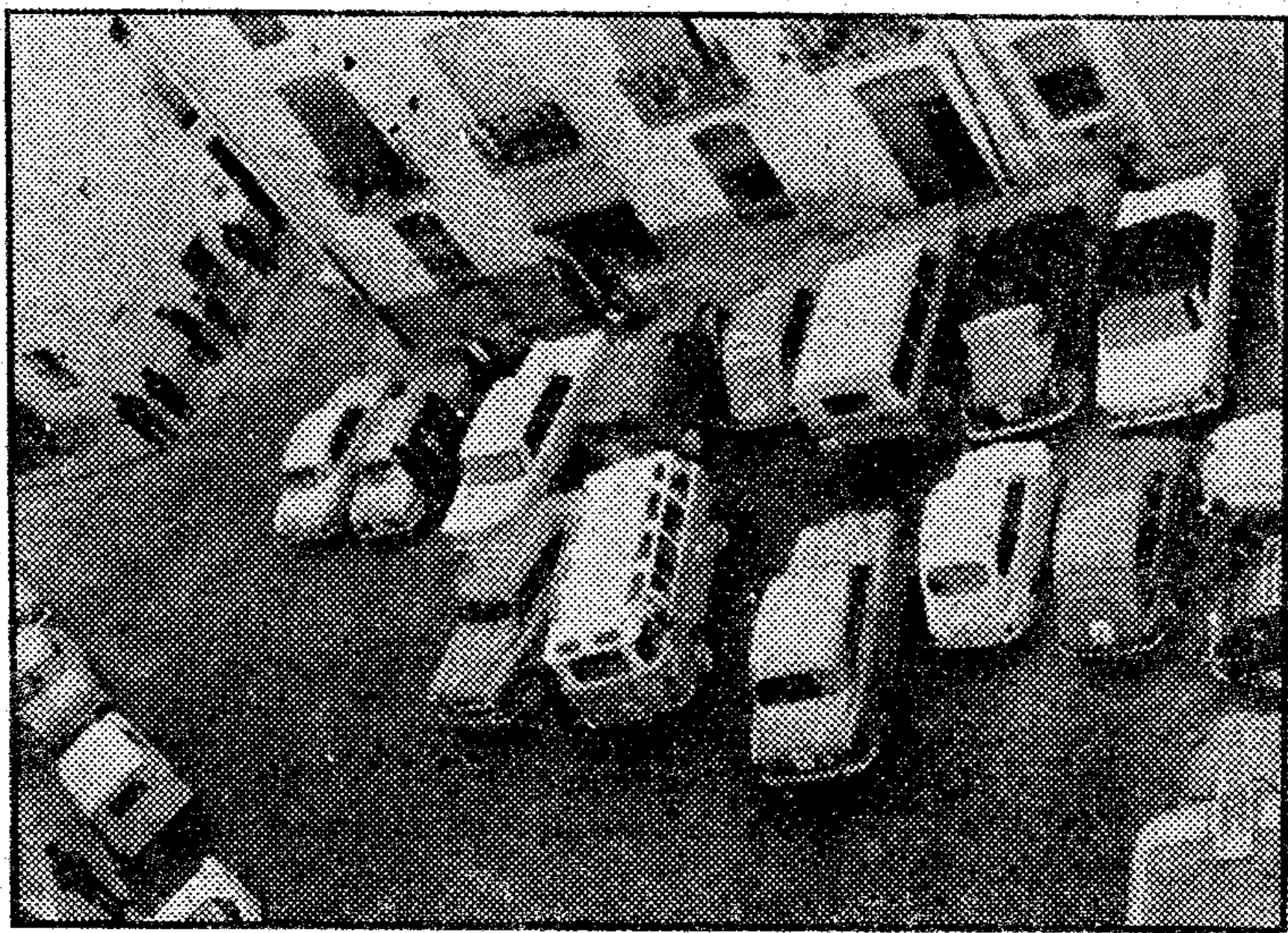
Aspecto que ofrecía la plaza Mayor de Tarbena, el domingo anterior, repleta de vehículos de los cursillistas expedicionarios.

El domingo anterior hubo una especie de concentración de cursillistas de Cristiandad en Tarbena. Al objeto de alentar a los católicos de aquella localidad, por iniciativa de los cursillistas ilicitanos, se desplazaron numerosos afectos a este gran movimiento cristiano de nuestros días, presidiendo algunas personalidades del Consejo Diocesano de Alicante. Los expedicionarios regresaron encantados de los fines alcanzados en dicha excursión.